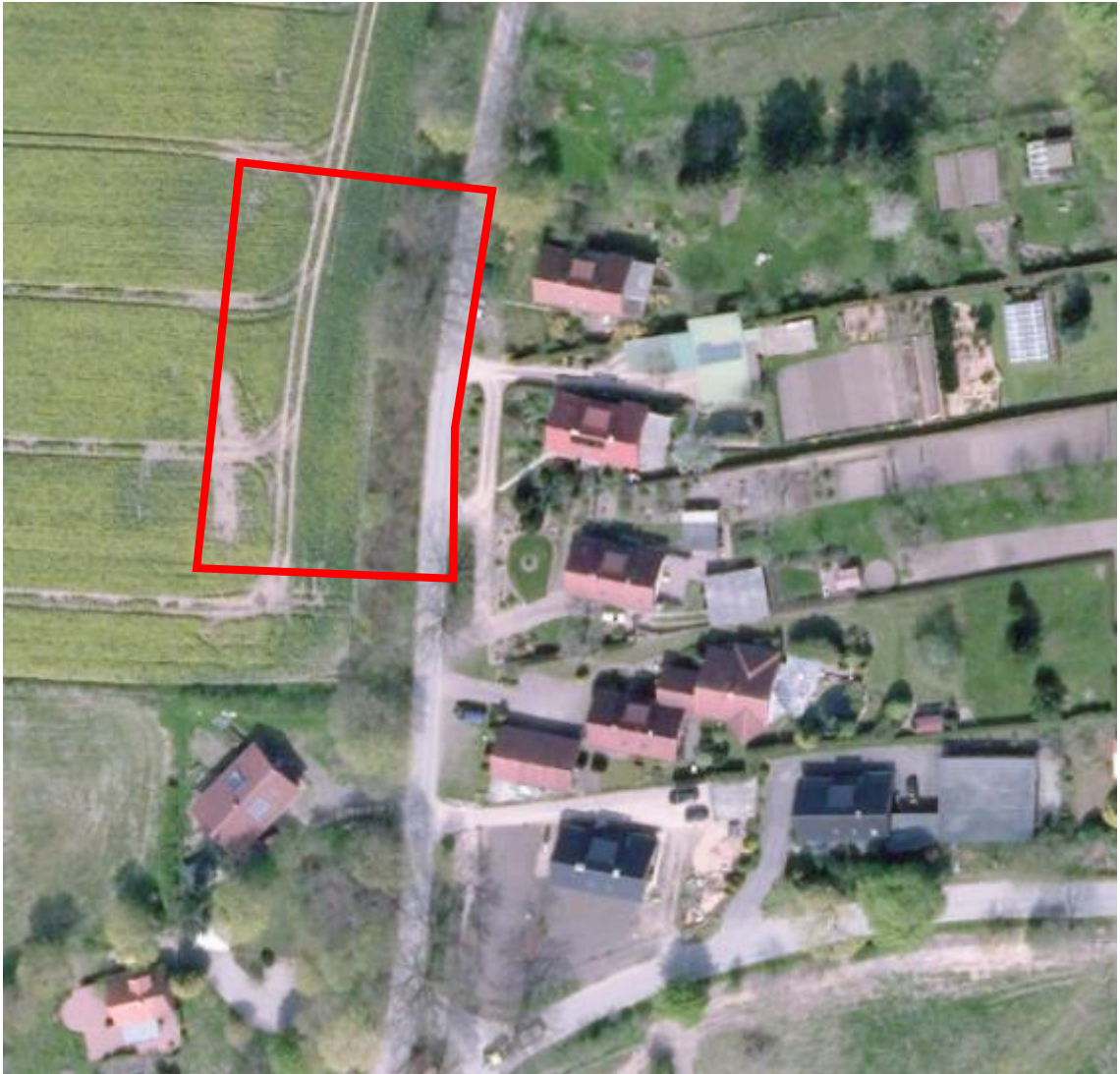
Abb.: Ausschnitt Luftbild mit Ergänzungsbereich

Die einbezogenen Flächen werden derzeit ackerbaulich bewirtschaftet. Von besonderer Bedeutung ist der Knick mit Eichen-Überhaltern entlang der Straße. Zwei prägende Eichen sind daher als zu erhaltend festgesetzt.